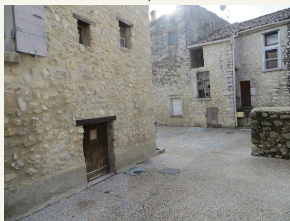
Rue de la Moutardière