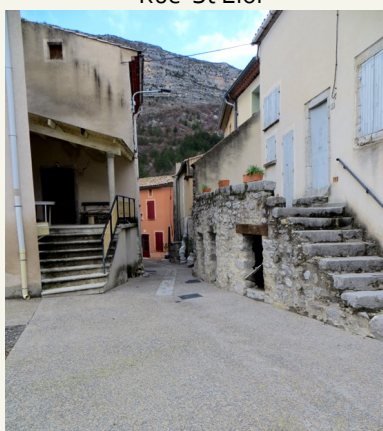
Rue St Joseph