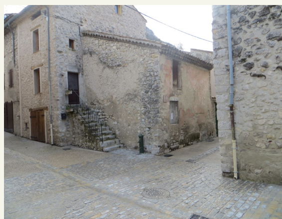
Place du corps mendiant