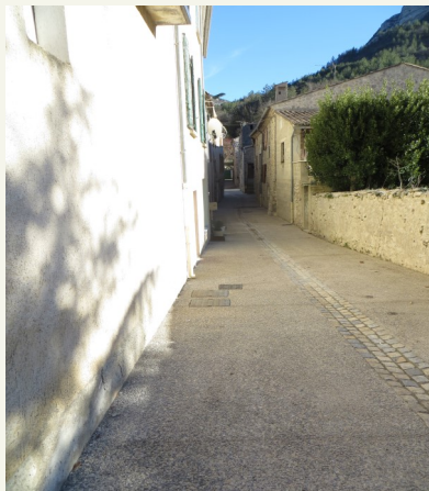
Rue St Eloi