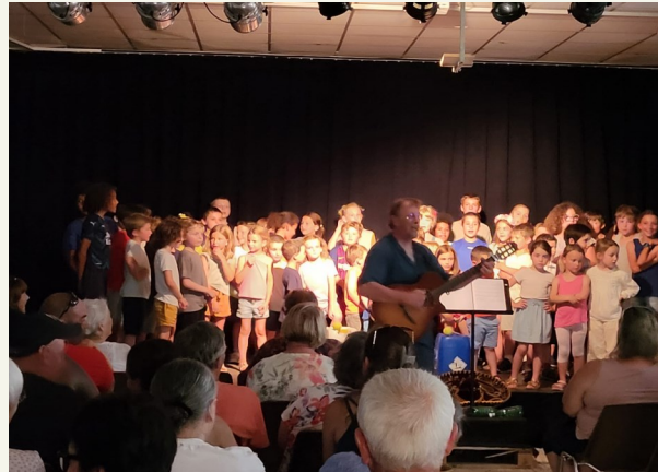
Fête de l'école aux Lavandes