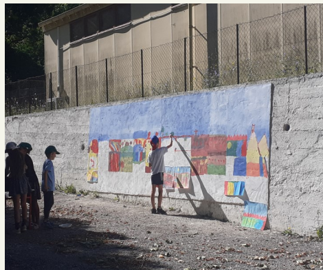
Fresque du mur de l'école