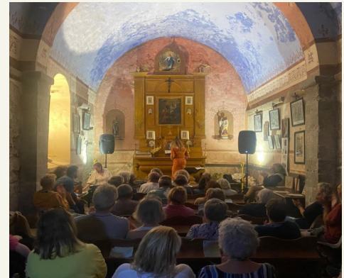
Nuit des églises à la chapelle St Michel