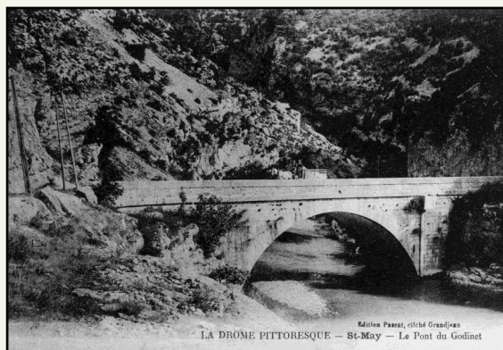
Edouard Pons, cliché Gasparin LA DRÔME PITTORESQUE - St-May - Le Pont du Godinet

Enfin dernier ouvrage d'art concerné, en 1996, le remplacement du nouveau pont de la Tune