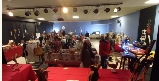
Marché de Noël aux Lavandes