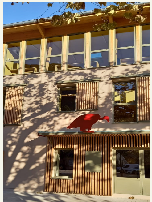
La maison des vautours