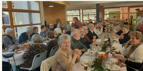
Repas du CCAS à la MARPA