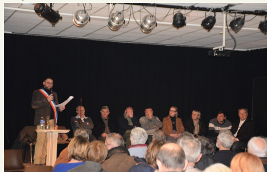
Vœux 4 janvier 2025 aux Lavandes